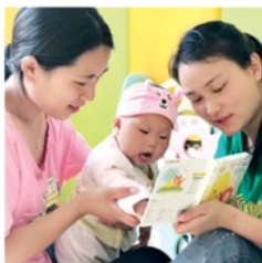
Parenting the Future (PTF) Hupan Modou (HPMD) Foundation