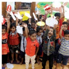
Think Equal Think Equal