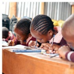
Stawisha Instructional Leadership Institute