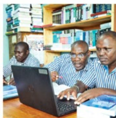
Legal Education, Training, and Practice Justice Defenders