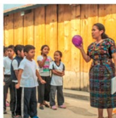
Education for Sharing (E4S) Education for Sharing