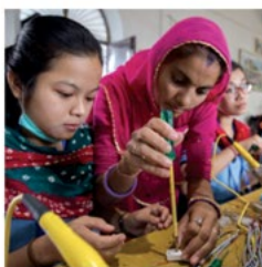
Barefoot College Solar Electrification with Enriched Education Barefoot College