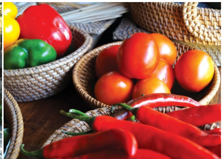
Danza del Barong, la más tradicional en Bali ( izquierda ). Oferta gastronómica de la región ( derecha ).

Indonesia cuenta con aproximadamente 17,500 islas, y se hablan más de 300 dialectos locales.