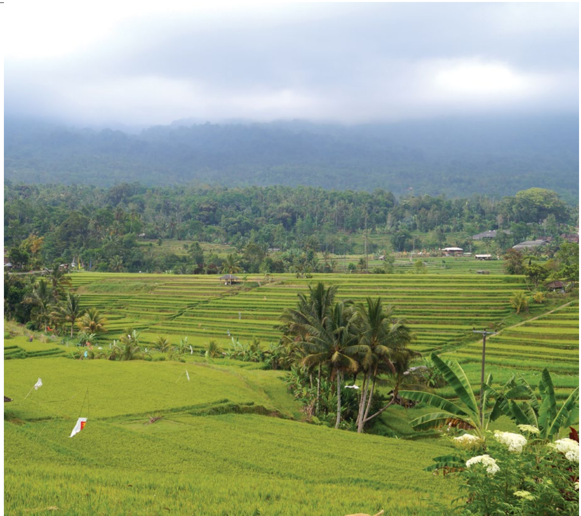
Los templos balineses son un oasis en medio de la ciudad ( izquierda ). Campos de arroz, declarados patrimonio cultural de la humanidad por la UNESCO ( derecha ).

pescado acompañadas con soya y limón. La cocina balinesa se basa en la preparación de vegetales fritos con aceite de coco y tallarines, así como pescados frescos a la parrilla cubiertos con una pasta de cúrcuma, jengibre y especias. Para los postres se utiliza el azúcar de palmera (ligero parecido con el piloncillo), y leche de coco.