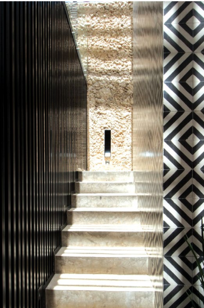
Construcción arquitectónica en tendencia en Chablé (izquierda). Apuesta arquitectónica contemporánea en Diez Diez (derecha).

No podemos dejar de mencionar las experiencias de bienestar de este hotel, creadas para que tu estancia sea curativa y placentera. Puedes participar en sesiones de yoga al aire libre, inmersiones en temazcal o incluso participar en una ceremonia maya, en la que, en compañía de plumas y copal, se busca una comunión renovadora con la madre Tierra.