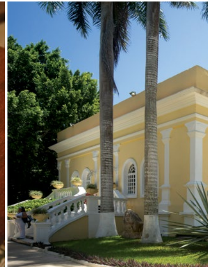
Cocina yucateca de vanguardia con ingredientes locales en Diez Diez (izquierda). Degustar lo recién aprendido en su zona de interpretación en el MUGY. (derecha).

Algo que distingue a Diez Diez de otros sitios de su categoría es su diseño: moderno y energético, en todas sus instalaciones abundan el cristal, el cuero, el concreto y la madera, todo en apego a las corrientes de diseño contemporáneo. Lo notarás sobre todo en sus suites , divididas en las categorías Estudio, Deluxe, Suite, Suite González Lugo Scabal y The Suite. Sin importar cuál elijas, tu estancia incluye los servicios de un concierge 24 horas, WiFi de alta velocidad, menú de almohadas y desayuno a la carta. Además, podrás disfrutar de música ambiental curada por el sello discográfico de Diez Diez. Si quieres hospedarte a lo grande, debes reservar The Suite, habitación emblema del hotel que cuenta con terraza privada con vistas al Paseo de Montejo, al bar y a la piscina. Además, podrás gozar de un jacuzzi al aire libre, ducha de lluvia y una decoración inspirada en el automovilismo deportivo.