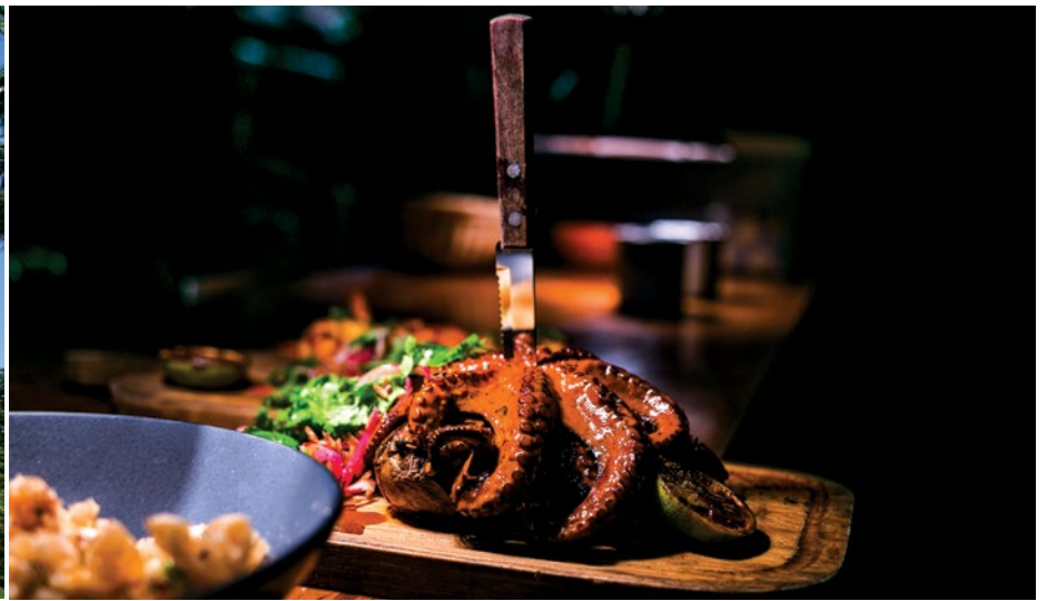
Palacio de la Música (izquierda). En Micaela, los platillos se centran en productos del mar cocinados a la leña. (derecha).

Si prefieres experimentar una actividad menos turística y más sustentable, debes apuntarte al recorrido en kayak por los manglares de Sisal, muy cerca de la capital estatal. El itinerario comprende una parada en la antigua aduana del puerto, que hace casi un siglo fue uno de los más activos de México. También conocerás casonas coloniales para luego adentrarte en los manglares a bordo de un kayak. En el trayecto verás toda clase de aves, peces y reptiles, y te explicarán la importancia de los manglares, encargados de limpiar el agua, nutrirlos y servir como barrera para los huracanes. Este tour es administrado y operado por guías comunitarios, por lo que tendrás asegurado que tu impacto económico se queda con los habitantes de la zona.