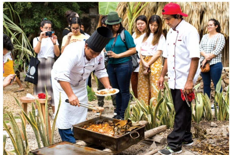
Réplica de una aldea maya donde es posible aprender cómo se prepara la cocina yucateca tradicional en el Museo de la Gastronomía Yucateca (MUGY).

Por supuesto, ninguna visita a Yucatán está completa si no se tiene una inmersión con su vida cultural y artística, que este 2021 cuenta con dos nuevos recintos. Uno de ellos es el Museo de la Gastronomía Yucateca (MUGY),