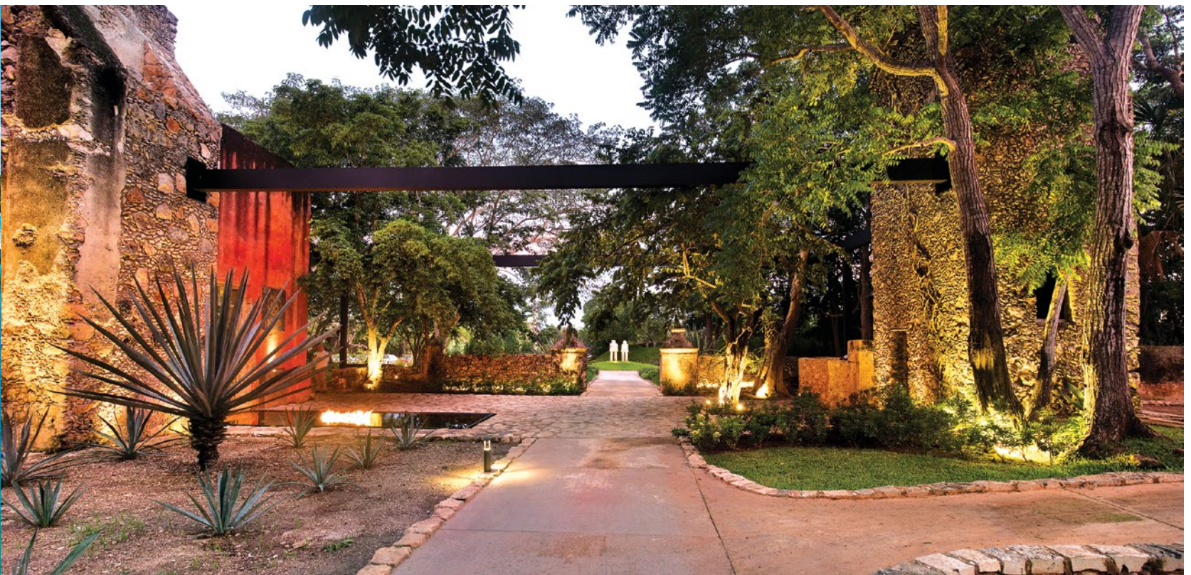
Tranquila playa en Yucatán (izquierda). Hermoso escenario en el hotel Chablé (derecha).