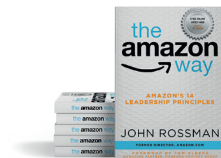
The Amazon Way. John Rossman

Esa es la pasión, el impulso y los insights que se necesitan tanto para cumplir con ese cliente hoy, como para pensar la forma de atenderlo más a fondo y mejor. Cuando estuve en Amazon,