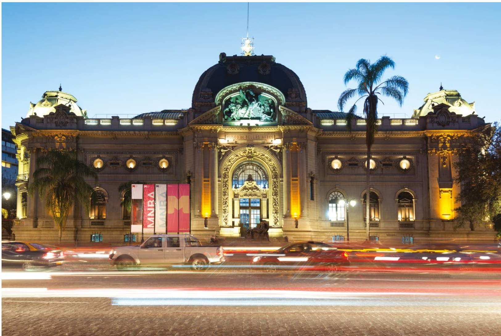
Museo Nacional de Bellas Artes, Chile.