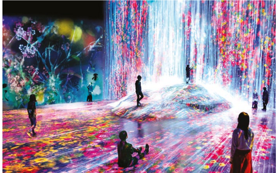
Superblue del artista estadounidense Jamer Turrell.

Cuando se reúnen artistas, programadores, ingenieros, especialistas en animación, matemáticos o arquitectos, surgen proyectos tan interesantes