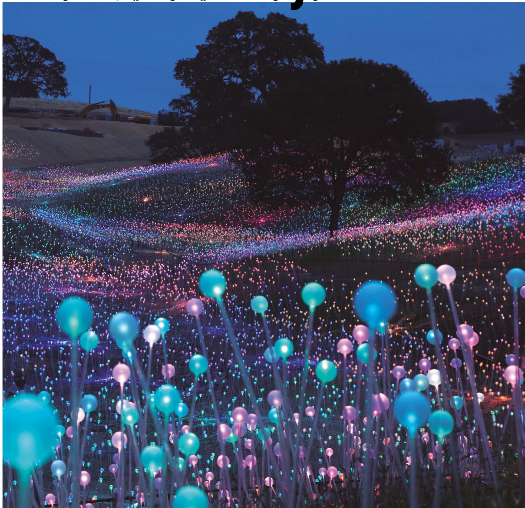
Field of Light obra de Bruce Munro.