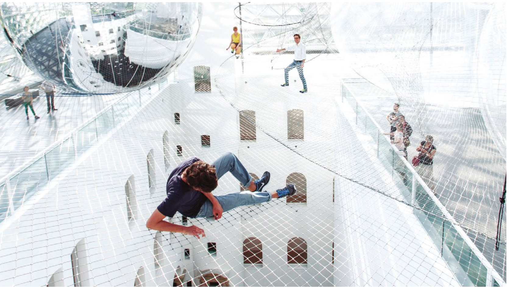
Telaraña monumental, titulada In Orbit .