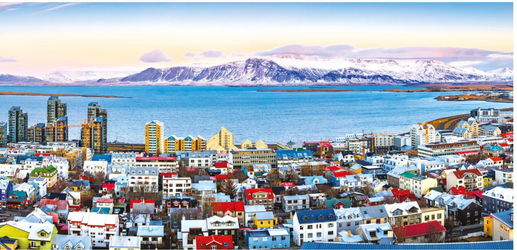
Reikiavik (arriba). Aguas termales de Geysir en Islandia. Círculo Dorado (abajo).