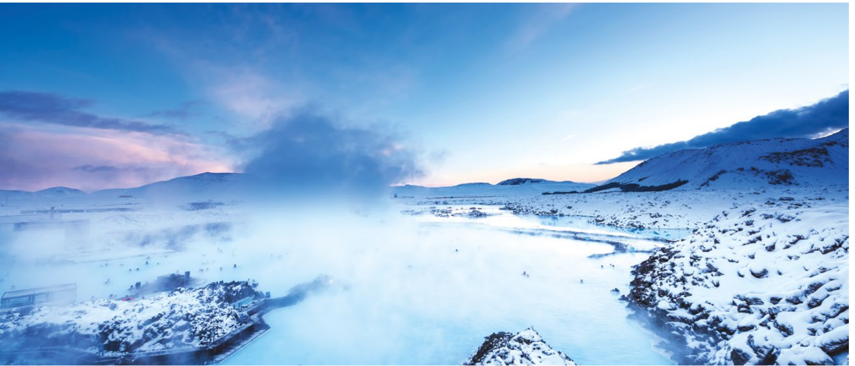
Hermoso paisaje y puesta de sol en las aguas termales de la Laguna Azul (arriba). Glaciar de Vatnajökull (abajo)