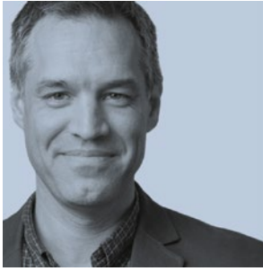
James Temple @jtemple P. 8