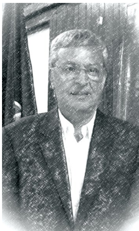
Álvaro Sáenz Saborío, presidente de la Unión Costarricense de Cámaras y Asociaciones de la Empresa Privada (UCCAEP).

Elaboramos dos documentos sobre la COVID, uno desde el punto de vista empresarial y otro sobre coexistir con el virus. Muchos políticos no entendieron que esta crisis sanitaria iba a derivar en una crisis económica, la cual va a estar reportando